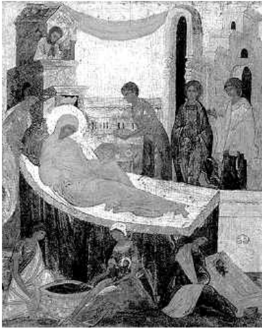
Рождество Богородицы. Икона XVI в.